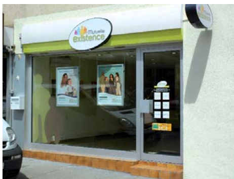
Agence de Sallanches

du lundi au vendredi de 9 h à 12 h et de 13 h 30 à 17 h 30