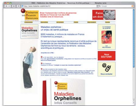
Site internet de la FMO : www.maladies-orphelines.fr