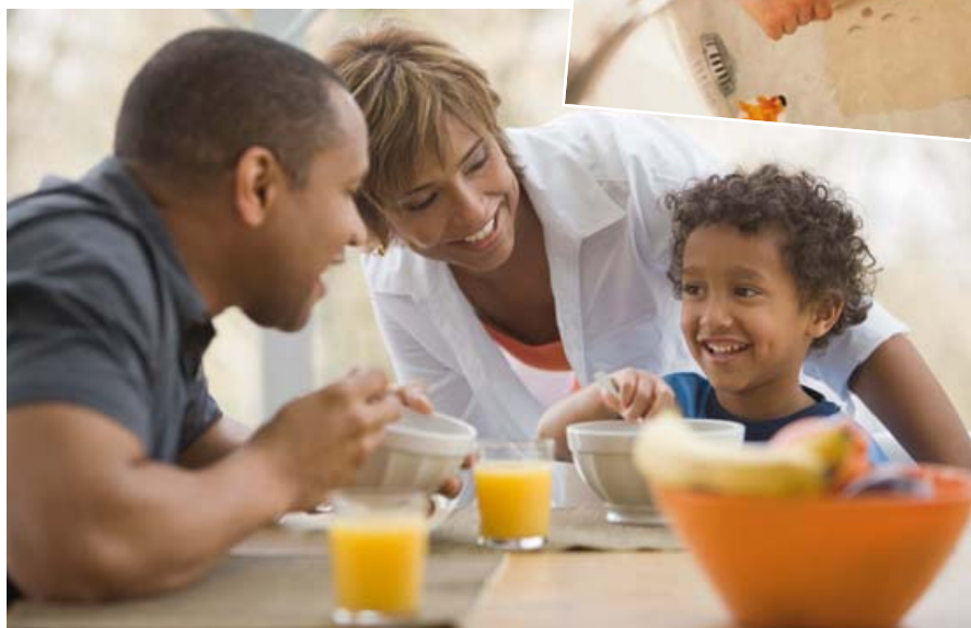
Pendant les premières années de sa vie, vous allez aider votre enfant à bien grandir.